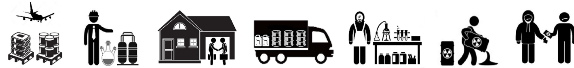
7 stappen barrièremodel synthetische drugs CCV

Hoe kenmerkt het criminele bedrijfsproces van synthetische drugsproductie zich in de eenheid Noord-Holland?